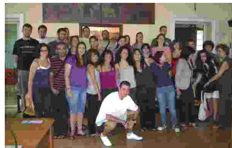
I partecipanti allo scambio sono stati ricevuti in sala consiliare