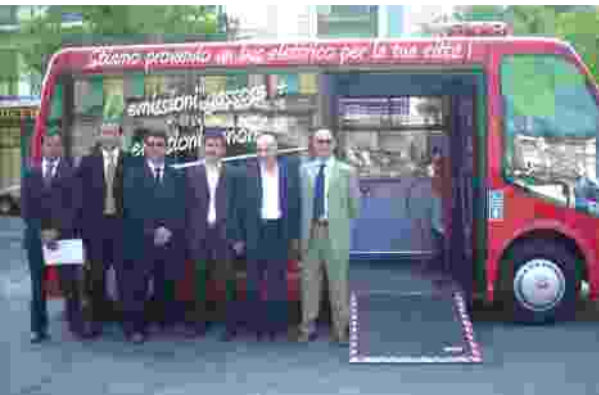
La presentazione del bus elettrico Zeus

L'obiettivo è di farne entrare in funzione due entro la fine del 2009 ed altri tre agli inizi del 2010. Hanno un'autonomia di 120 chilometri, con emissioni nulle