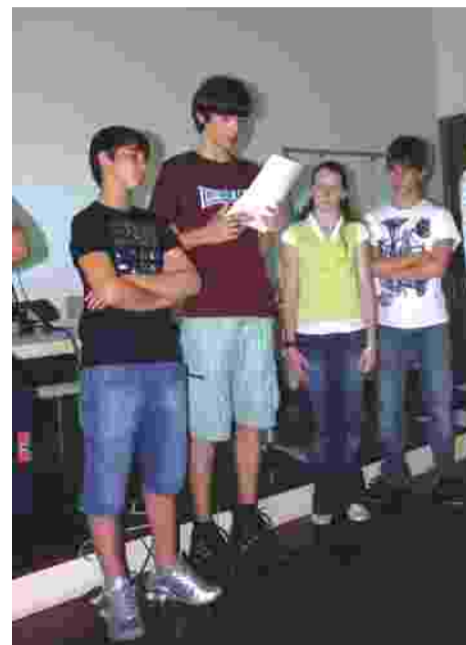
La presentazione del "Protocollo di Kyoto venetiano" da parte degli studenti