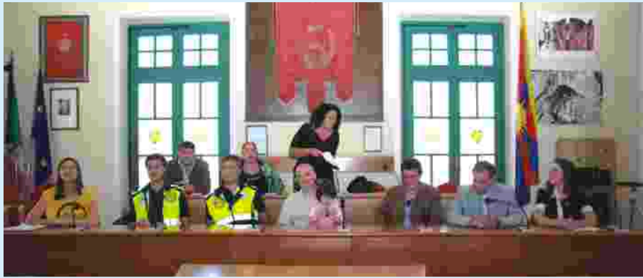
L'incontro delle autorità con i giovani abruzzesi (nella foto sotto, in visita a Venaria)

La città a fianco delle popolazioni colpite dal terremoto Ospitato un gruppo di giovani ed inviati i medicinali