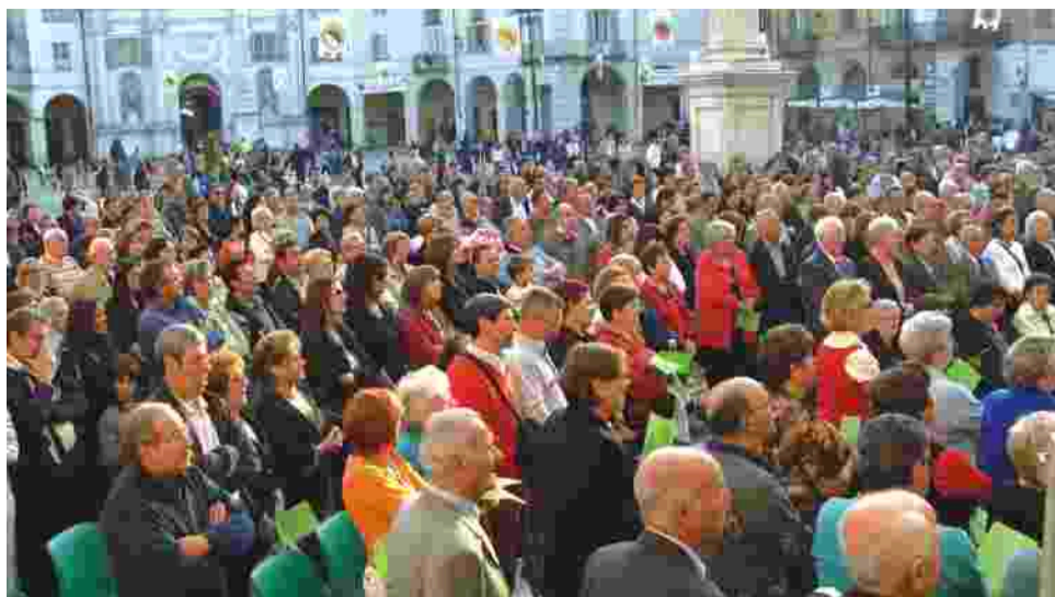
Un momento di raccoglimento dei numerosi fedeli in piazza Annunziata, durante la solenne messa all'aperto, in occasione della chiusura della festa patronale 2008