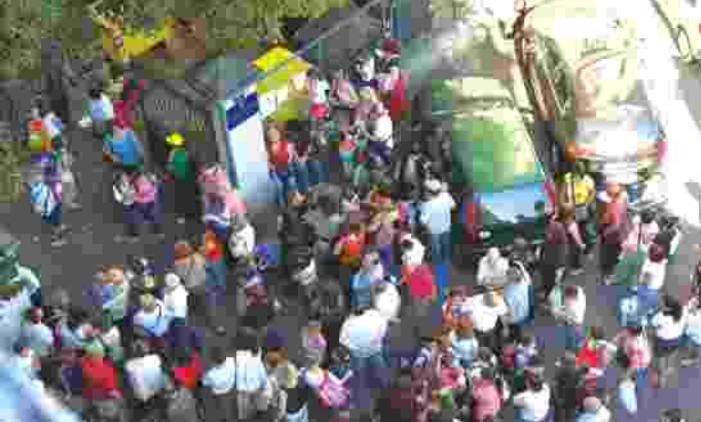
L'ingresso della scuola materna De Amicis: attuate riduzioni sulle tariffe delle mense e dei centri estivi

Numerose le azioni messe in campo dalla Città di Venaria Reale, dal Patto territoriale Zona Ovest e dal Cissa