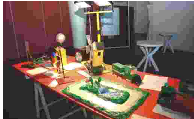
Da sinistra: un momento del dibattito generale di Agenda 21; l'info-container allestito dal Museo A come Ambiente, e modelli per il risparmio energetico realizzati dagli studenti