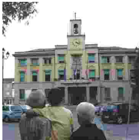
Contributi per le famiglie con anziani non autosufficienti. Sui rifiuti, riduzioni della Tia e allargamento delle fasce di esenzione

Il Cissa prevede un contributo straordinario di sostegno al reddito per fronteggiare la crisi. Possono inol-