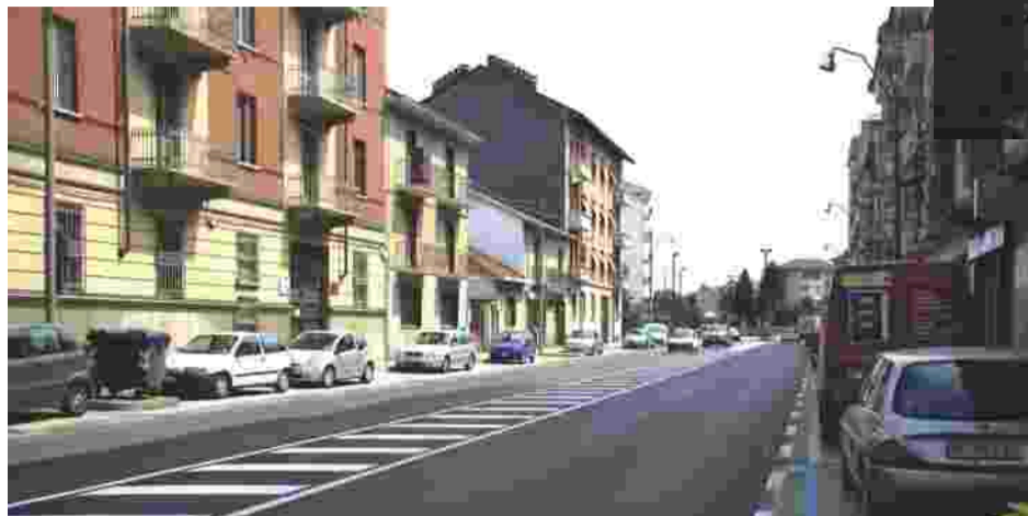
Il nuovo manto stradale realizzato in corso Garibaldi e, in alto, i lavori all'incrocio tra via Goito e via Juvarra, avviati in luglio per realizzare i nuovi passaggi pedonali rialzati

Altre opere di rallentamento sono le quattro rotonde in costruzione. Queste rotonde, dislocate davanti al comando dei Carabinieri, all'incrocio fra corso Machiavelli e via Guarini, fra via Barbi Cinti e corso Machiavelli ed infine all'incrocio fra corso Puccini e via Petrarca, saranno ognuna caratterizzata da un elemento decorativo particolare: