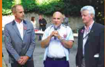
GLI AUGURI DI BUON 2010 DAL SINDACO DI VIZILLE, SERGE GROS, DALLA CITTÀ TRANSALPINA GEMELLATA