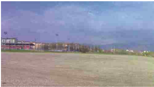
L'area di strada Lanzo già bonificata e lasciata libera

Del trasferimento in corso Cuneo si è parlato in un'affollata assemblea pubblica convocata dal sindaco Nicola Pollari lo scorso giovedì 3 dicem-