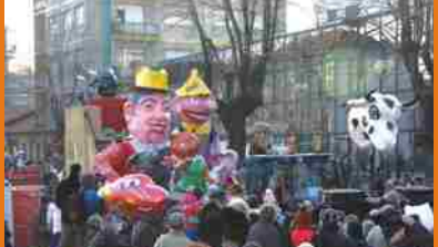
DOMENICA 14 FEBBRAIO SFILATA DEL REAL CARNEVALE. LA PARTENZA DA PIAZZA MICHELANGELO