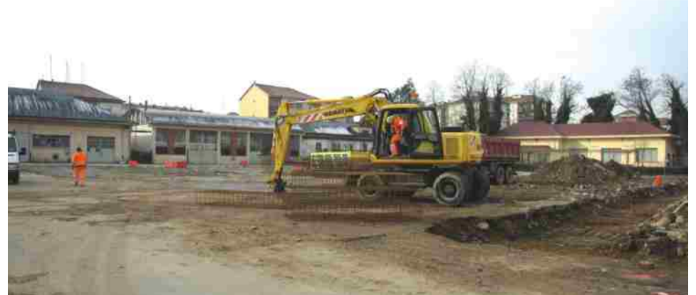
I lavori in corso nell'area esterna dell'ex caserma Beleno, per la nuova biblioteca

La nuova biblioteca sarà un luogo accessibile, per tutti. Per questo la Fondazione Via Maestra ha cercato il contributo della Fondazione Paideia di Torino, chiedendo sovvenzioni per sussidi didattici, in particolare per la disabilità visiva, con ausili per ipovedenti e non vedenti, quali audiobook, software di sintesi vocale su alcune postazioni Pc, e ancora videoingranditori per la lettura dei giornali che comporranno l'emeroteca. È previsto l'uso della barra braille. Per quanto concerne la disabilità uditiva, la sala conferenze e polifunzionale (capienza di circa 100 persone) verrà dotata di un sistema di amplificazione ad induzione magnetica, di un sistema video a ripresa fissa ed ampio schermo per proiezione, che consente la proiezione in tempo reale di interpretariato in lingua dei segni