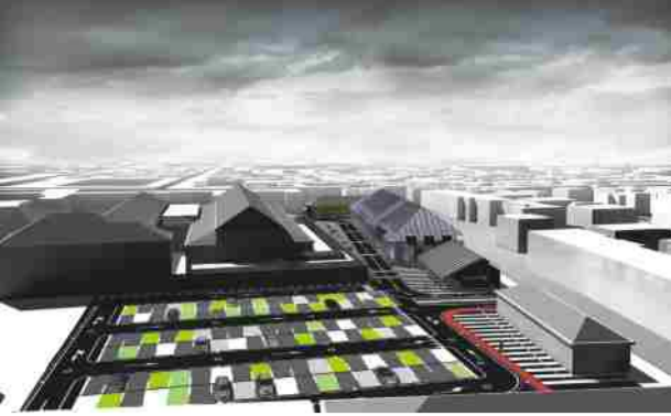
La nuova biblioteca vista dall'alto

Uno spazio accogliente per giovani, adulti, anziani e disabili, grazie all'abbattimento delle barriere architettoniche ed all'introduzione di percorsi tattili per gli ipovedenti