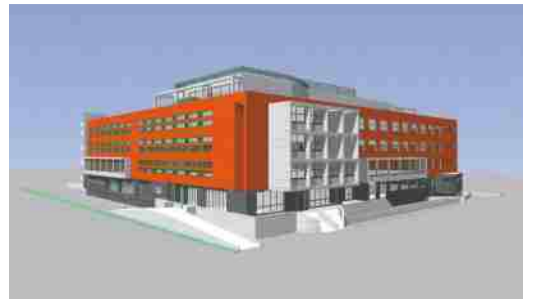
Una prospettiva della nuova struttura ospedaliera

ed un bar, il 118 e la Guardia Medica. Al primo piano gli uffici della direzione sanitaria, la dialisi, il servizio di recupero e rieducazione funzionale con degenza, numerosi ambulatori ed il servizio di endoscopia digestiva. Al secondo piano la degenza di chirurgia, il blocco operatorio e la centrale di sterilizzazione ed infine, al terzo piano, la degenza di medicina, il day hospital, il day surgery ed il day hospital oncologico.