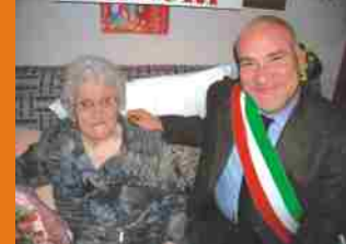
TRE CENTENARIE VENARIESI IN POCHE SETTIMANE. SONO STATE FESTEGGIATE DALL'AMMINISTRAZIONE COMUNALE